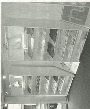
ニシキ株式会社「介護商品ショールーム」。排泄トラブルの改善法の提案も

商品」を買おうとしても、どれを選んで良いかわからないものです。そこでおばあちゃんの知恵袋がおすすめしたいのが、ニシキ株式会社です。