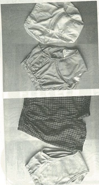
▲男性用安心パンツ

失禁用商品と言うと、紙オムツをイメージされる方が多いと思います。紙オムツは使い捨てで便利ですが、アンケートなどの調査報告を見る限り、「なんで自分が紙オムツを…」という精神的ダメージが非常に強く、い