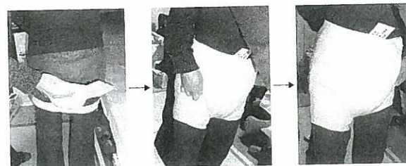
写真3-3 布のホルダーパンツの当て方

インナーには、利用者の尿量などに合った尿取りパッドを使用し、立体ギャザーの高さが高いものを選びます。