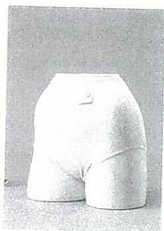
写真3-1 ショーツタイプのホルダーパンツ

綿素材で伸縮性に富むものや化繊など、素材はさまざまですが、縦横の伸縮性は商品によって異なります。伸縮性に富み、股部に