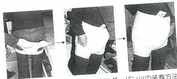
写真6-3 尿取りパッドとホルダーパンツの装着方法

ベッド上で尿取りパッドを交換する場合は、全開する布のホルダーパンツ（内ベルトタイプ）が便利です（写真6-4）。