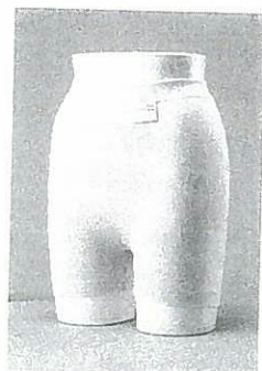
写真3-2 ロングタイプのホルダーパンツ

しっかりと尿取りパッドを固定できるものを選びます。このパンツは何よりも、履き心地のよさと下着らしさが大きな利点です。布のホルダーパンツを使用するとき、インナーの尿取りパッド（紙）は立体ギャザーの高さが高いものを選び、股間に隙間ができないように尿取りパッドの立体ギャザーをフィットさせます（写真3-3）。