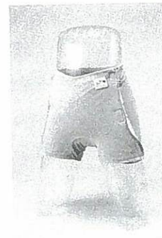
写真3-5 内ベルトのついたホルダーパンツオープンタイプ（159頁参照）